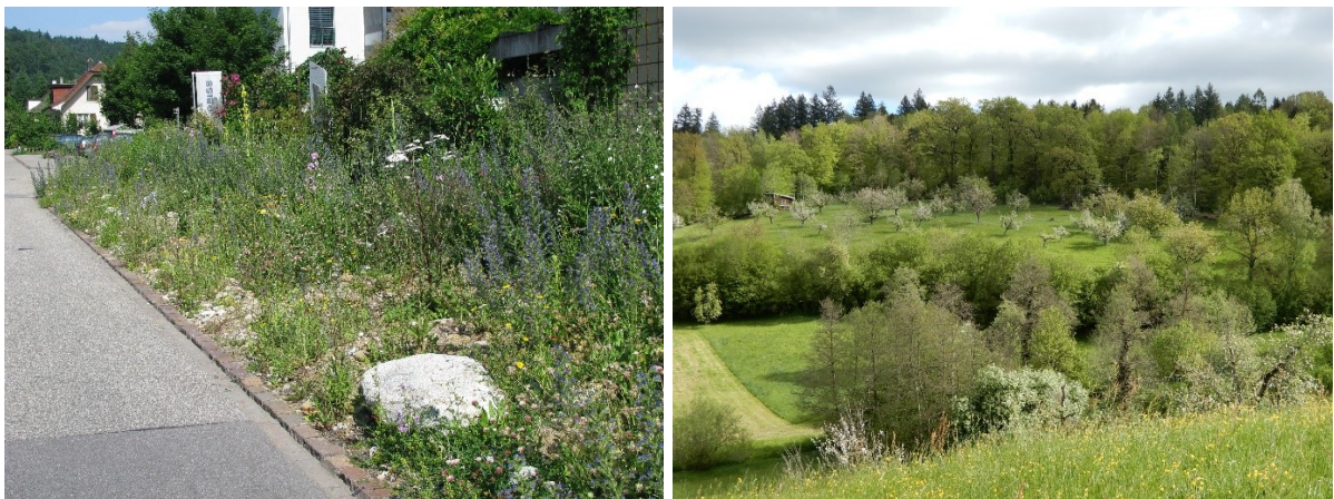
Grünflächen im Siedlungsraum und in der Kulturlandschaft Zofingen