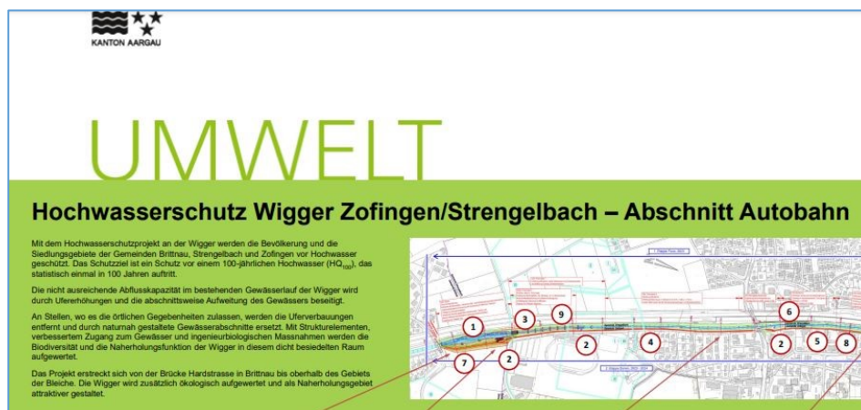
Info-Tafel des Kantons

Anmeldung unter: www.zofingen.ch/biodiversitaet oder https://www.zofingen.ch/services/online-schalter.html/224/addForm/1759/product/769/quantity/1/userdefinedprice/0 )